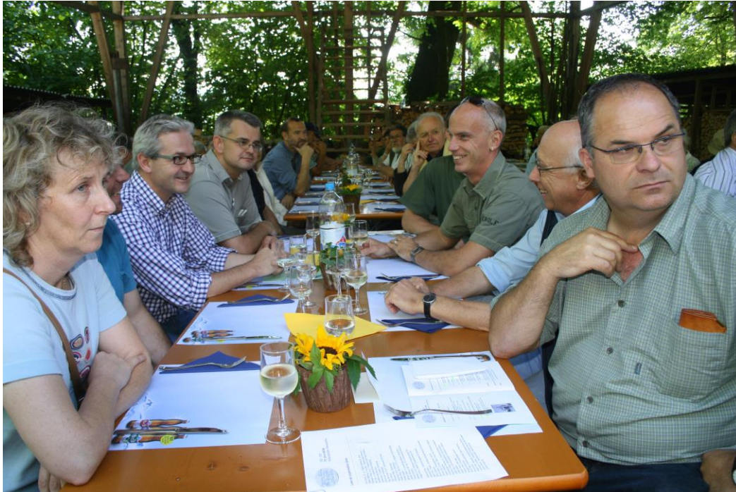
Forstprominenz am gleichen Tisch

Auch heute noch ist beinahe die Hälfte aller Besitzerpersonen, nämlich 36, im Stadtkreis Oberwinterthur wohnhaft. Insgesamt 57 wohnen in der Gemeinde Winterthur, und nur 4 Personen haben ihren Wohnsitz ausserhalb des Kantons Zürich.