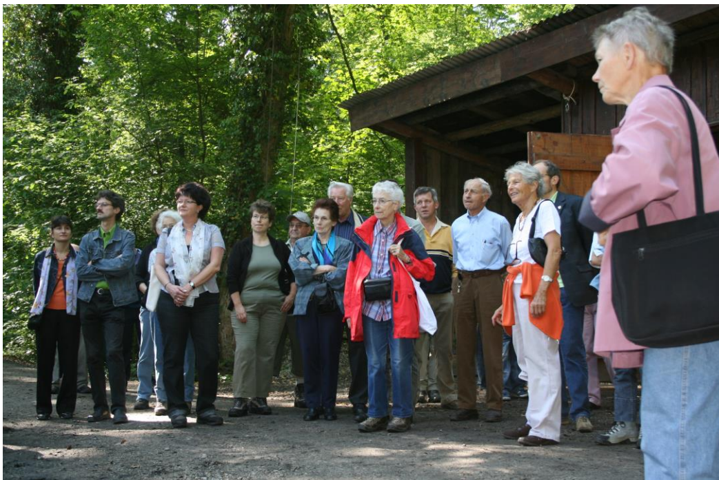
Beim Kohlenmeiler im Forsthaus Andelbach